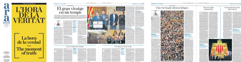
Page couverture, pages 2-3 et 10-11 du supplément trilingue The Moment of Truth publié dans le quotidien Ara le 15 décembre 2013.