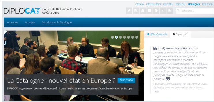
c. Page d'accueil du site Diplocat (7 février 2017).