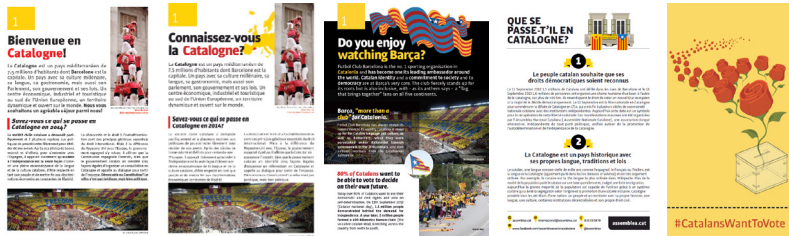
Recto des tracts Bienvenue en Catalogne! , Connaissez-vous la Catalogne? , Do you enjoy watching Barça? , Que se passe-t-il en Catalogne? et Sant Jordi .