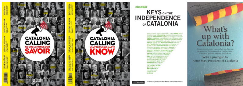
Figure 4 Livres figurant au corpus

Page couverture des trois livres figurant au corpus : Catalonia Calling (versions française et anglaise), Keys on the independence of Catalonia (version anglaise) et What's up with Catalonia? (version anglaise).